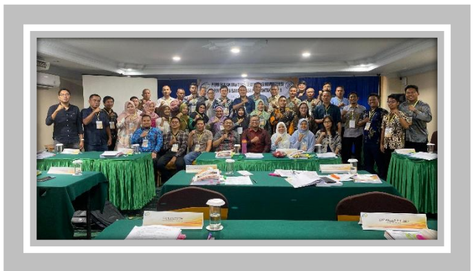
Pelaksanaan Kegiatan Ujian Sertifikasi Pengadaan Barang dan Jasa Pemerintah Level 1 23 – 26 Oktober 2024 di Hotel Madani, Medan