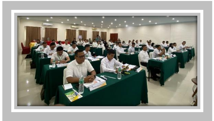
Pelaksanaan Kegiatan Ujian Sertifikasi Pengadaan Barang dan Jasa Pemerintah Level 1 30 April – 4 Mei 2024 di Hotel Angkasa Garden, Pekanbaru