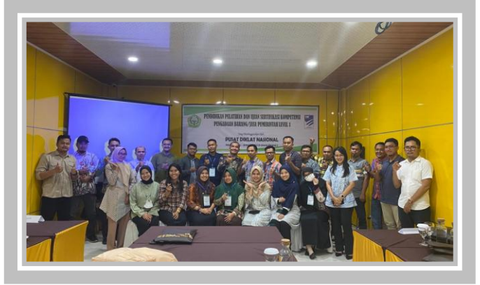
Pelaksanaan Kegiatan Ujian Sertifikasi Pengadaan Barang dan Jasa Pemerintah 27 Februari – 18 Maret 2023 di Graha Edukasi 2 Pusdiknas Pekanbaru