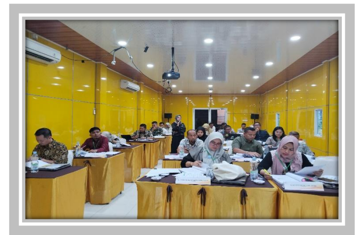
Pelaksanaan Kegiatan Ujian Sertifikasi Pengadaan Barang dan Jasa Pemerintah 5 – 29 Februari 2024 di Graha Edukasi 2 Pusdiknas Pekanbaru.