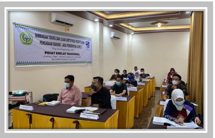
Pelaksanaan Kegiatan Ujian Sertifikasi Pengadaan Barang dan Jasa Pemerintah Level 1 20 – 23 April 2022 di Graha Edukasi 2 Pusdiknas Pekanbaru