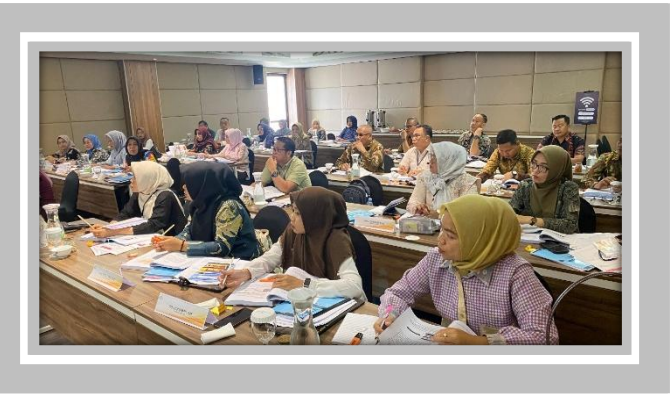
Pelaksanaan Kegiatan Ujian Sertifikasi Pengadaan Barang dan Jasa Pemerintah Level 1 31 Juli – 1 Agustus 2025 di Hotel Emilia, Palembang