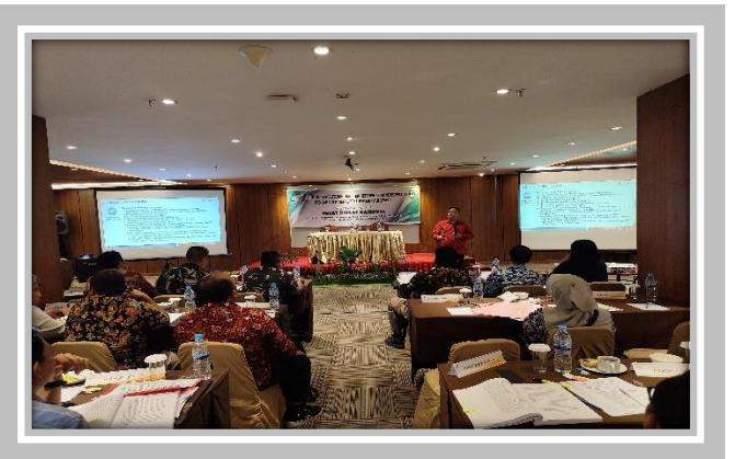
Pelaksanaan Kegiatan Ujian Sertifikasi Pengadaan Barang dan Jasa Pemerintah 12 Februari – 2 Maret 2024 di Hotel Le Polonia, Medan