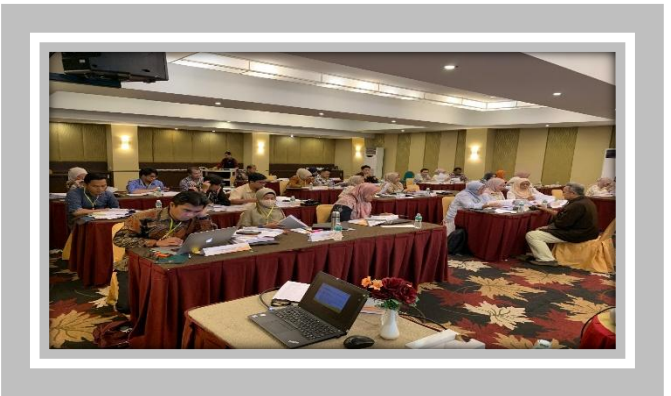
Pelaksanaan Kegiatan Ujian Sertifikasi Pengadaan dan Jasa Pemerintah Level 1 8 – 10 Mei 2025 di Hotel Pangeran City, Padang