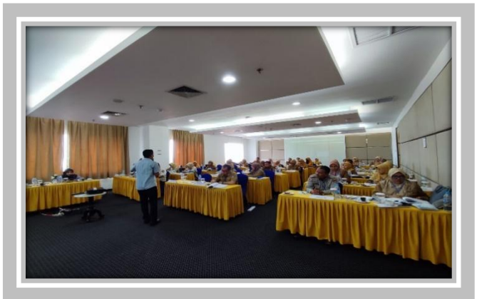
Pelaksanaan Kegiatan Ujian Sertifikasi Pengadaan Barang dan Jasa Pemerintah 6 – 25 Maret 2023 di Hotel Grand Basko Padang