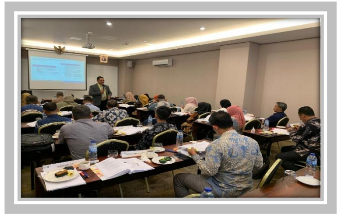
Pelaksanaan Kegiatan Ujian Sertifikasi Pengadaan Barang dan Jasa Pemerintah 5 – 29 Februari 2024 di Hotel Grand Zury Padang