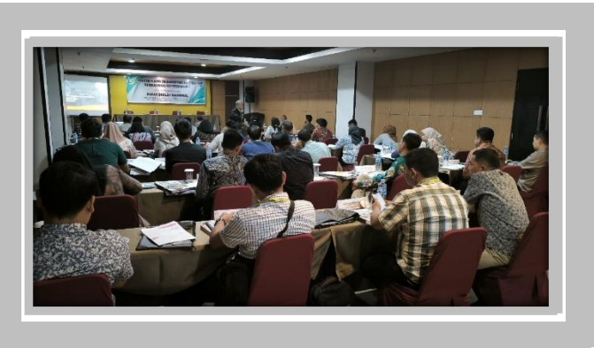
Pelaksanaan Kegiatan Ujian Sertifikasi Pengadaan Barang dan Jasa Pemerintah Level 1 24 – 26 Juli 2025 di Hotel Grand Antares, Medan