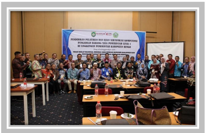
Pelaksanaan Kegiatan Ujian Sertifikasi Pengadaan Barang dan Jasa Pemerintah 30 Oktober – 18 November 2023 di Hotel Amaris Muara Bungo, Bungo.