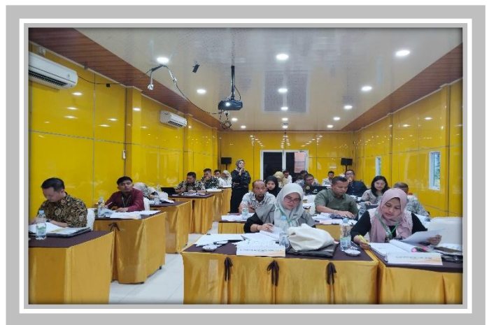
Pelaksanaan Kegiatan Ujian Sertifikasi Pengadaan Barang dan Jasa Pemerintah 5 – 29 Februari 2024 di Graha Edukasi 2 Pusdiknas Pekanbaru.