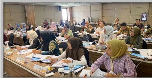
Pelaksanaan Kegiatan Ujian Sertifikasi Pengadaan Barang dan Jasa Pemerintah Level 1 31 Juli – 1 Agustus 2025 di Hotel Emilia, Palembang