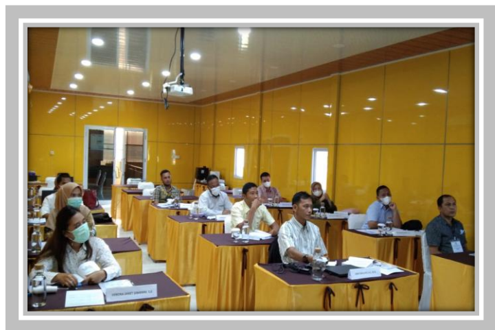
Pelaksanaan Kegiatan Ujian Sertifikasi Pengadaan Barang dan Jasa Pemerintah Level 1 18 – 21 Mei 2022 Graha Edukasi 2 Pusdiknas Pekanbaru