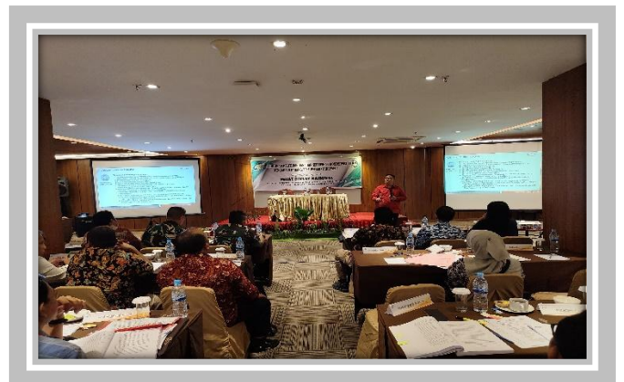
Pelaksanaan Kegiatan Ujian Sertifikasi Pengadaan Barang dan Jasa Pemerintah 12 Februari – 2 Maret 2024 di Hotel Le Polonia, Medan