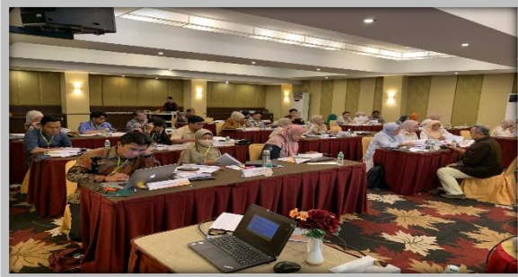
Pelaksanaan Kegiatan Ujian Sertifikasi Pengadaan Barang dan Jasa Pemerintah Level 1 8 – 10 Mei 2025 di Hotel Pangeran City, Padang