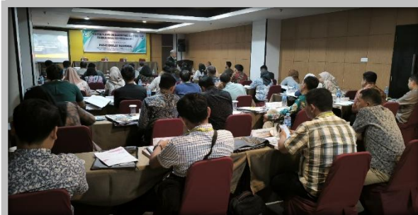
Pelaksanaan Kegiatan Ujian Sertifikasi Pengadaan Barang dan Jasa Pemerintah Level 1 24 – 26 Juli 2025 di Hotel Grand Antares, Medan