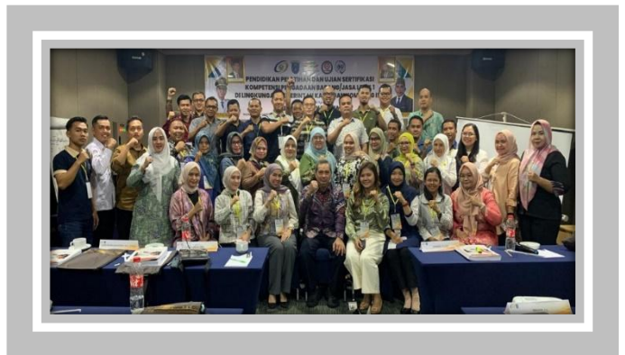
Pelaksanaan Kegiatan Ujian Sertifikasi Pengadaan Barang dan Jasa Pemerintah Level 1 16 – 19 Oktober 2024 di Hotel Batiqa, Palembang